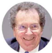
GIAN MARIA GROS-PIETRO Presidente Intesa Sanpaolo

Fonte: Intesa Sanpaolo Integrated Database (ISID) e Istat