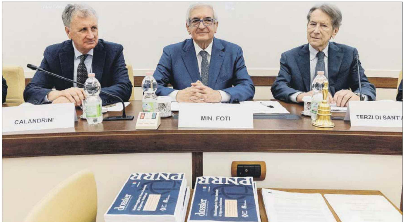
Il ministro degli Affari europei, Coesione territoriale e Pnrr, Tommaso Foti, il 3 giugno scorso in audizione davanti alle commissioni congiunte di Bilancio e Affari comunitari