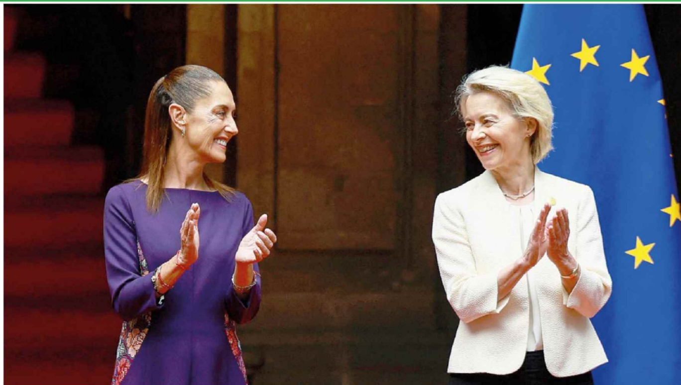
Potere al femminile. La presidente del Messico Claudia Sheinbaum riceve la presidente della Commissione europea, Ursula von der Leyen