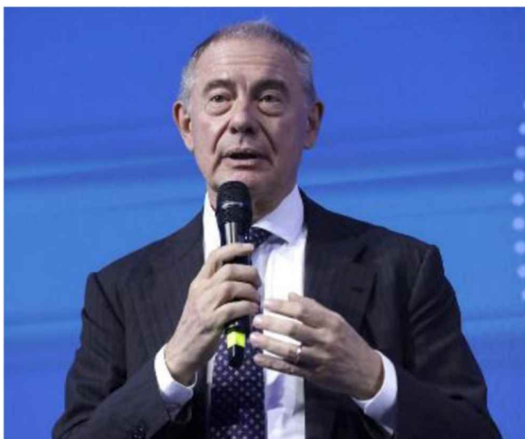
Il ministro delle Imprese e del Made in Italy, Adolfo Urso