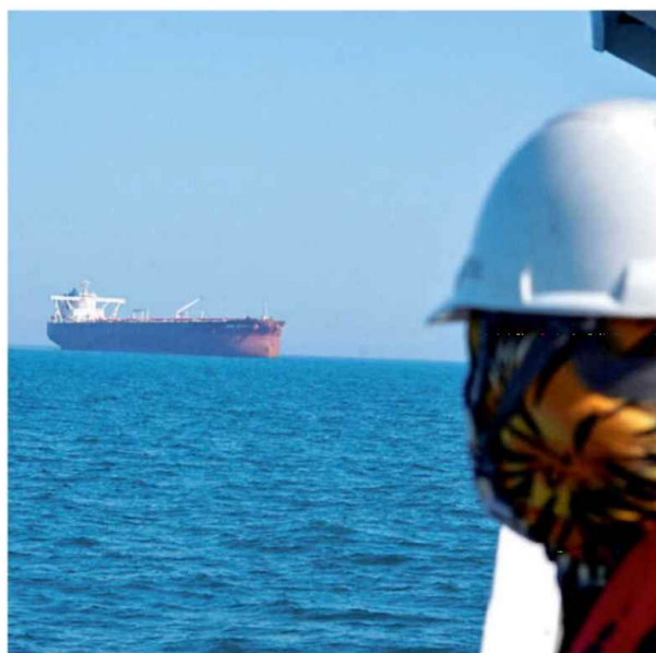
⚠️ Petroliera bloccata nel Golfo Persico: in un mese e mezzo il divieto di transito ha coinvolto migliaia di navi