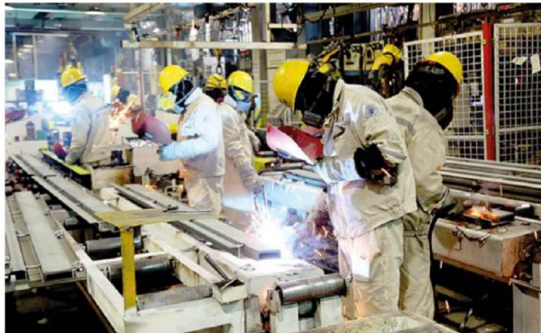
Imprese. Crescono i finanziamenti al settore produttivo

Note: (1) Ultimi dati ufficiali disponibili. (2) Il dato si riferisce alla variazione dei prestiti corretti per tenere conto delle cartolarizzazioni, cessioni e cancellazioni e delle variazioni di valore non connesse a transazioni (ad. esempio, variazioni dovute a fluttuazioni del cambio, ad aggiustamenti di valore o a riclassificazioni).