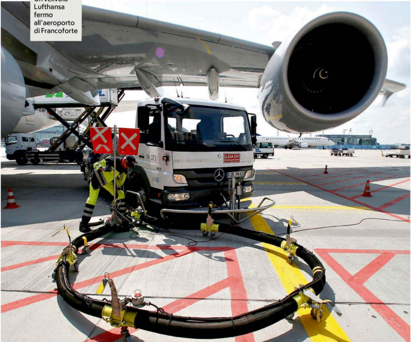
Un velivolo Lufthansa fermo all'aeroporto di Francoforte

Aci Europe rappresenta i 600 aeroporti (tra cui Fiumicino e Linate) di 55 Paesi anche comunitari. Ha inviato una lettera ai commissari Tzitzikostas (Turismo sostenibile) e Jørgensen (Energia)