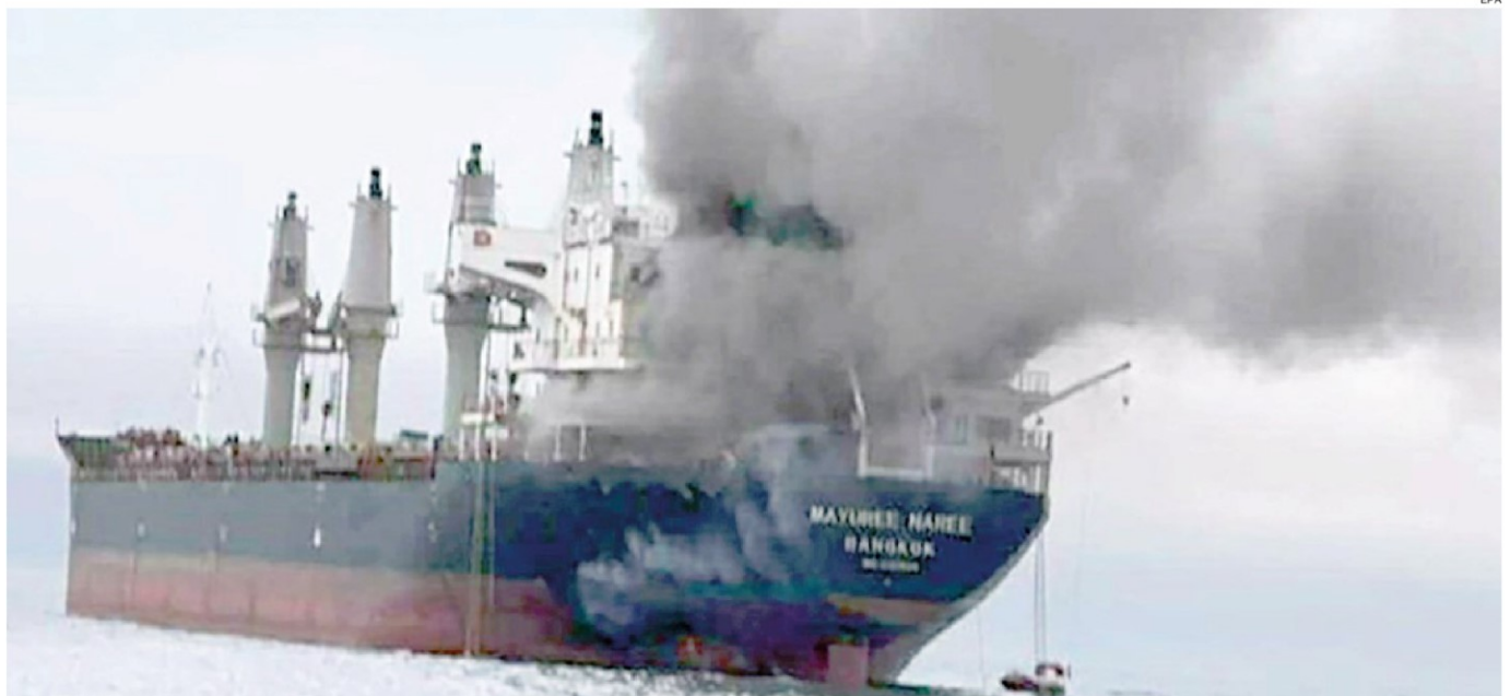
Cargo in pericolo. La nave cargo thailandese Mayuree Naree in fiamme nello Stretto di Hormuz dopo essere stata colpita da un missile iraniano