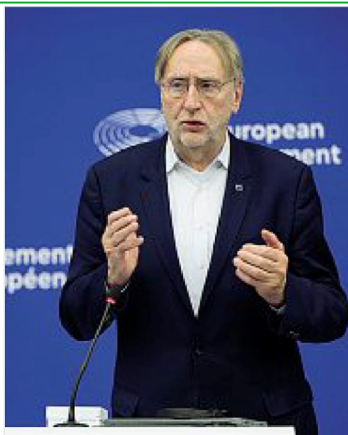
Parlamento Ue Bernd Lange, presidente della commissione per il Commercio internazionale