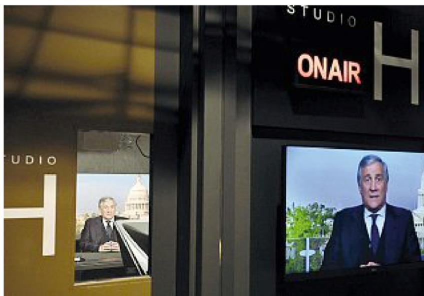
A Washington Il ministro degli Esteri Antonio Tajani durante un'intervista alla Cnn

Oggi a Bruxelles il ministro degli Esteri Antonio Tajani parteciperà prima alla riunione del Consiglio Affari Esteri, che avrà come focus l'Ucraina. Si riunirà poi in videoconferenza con i ministri del Commercio del G7 e presiederà la riunione della «Task Force dazi» con 40 imprese italiane e circa 80 associazioni di categoria, per discutere gli ultimi sviluppi della guerra commerciale.