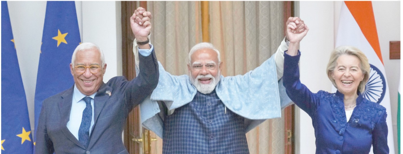
New Delhi. Da sinistra il presidente del Consiglio europeo Antonio Costa, il premier indiano Narendra Modi e la presidente della Commissione Ursula von der Leyen