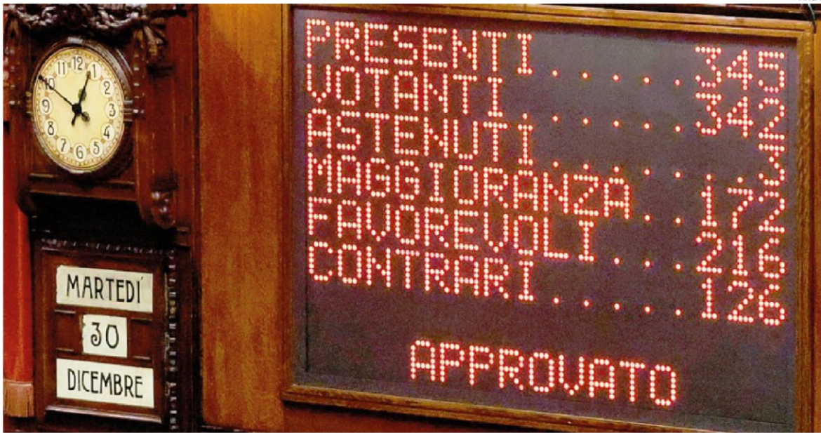
L'iter in Parlamento. Il tabellone della Camera mostra il risultato del voto finale sulla Legge di Bilancio 2026