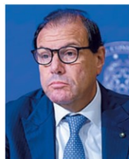
Maurizio Leo Viceministro all'Economia, di Fratelli d'Italia