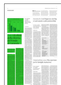
Superficie 30 %