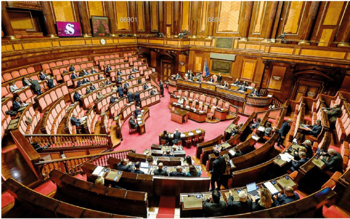
Fiducia. Dopo l'ok del Senato (in foto l'Aula di Palazzo Madama) il governo porrà la fiducia alla Camera sul decreto Anticipi.