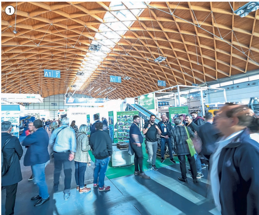
① Ecomondo torna alla Fiera di Rimini. Quella in programma è la ventiseiesima edizione