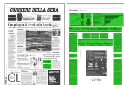
Superficie 78 %