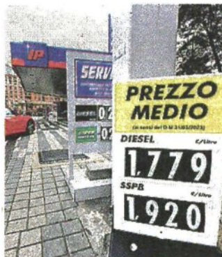
Il cartello obbligatorio del prezzo medio

● Il governo intende potenziare la rete di ricariche elettriche con un contributo per sostenere le spese per il potenziamento del collegamento alla rete di distribuzione