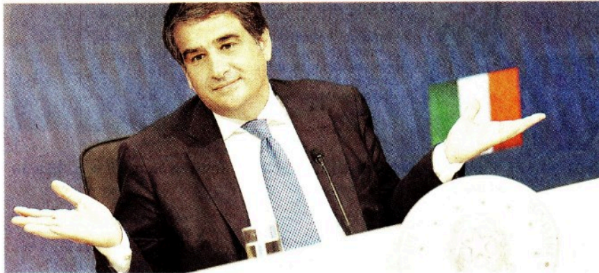
La presentazione. Raffaele Fitto, il ministro per gli Affari Europei, per il Pnrr e per la Coesione