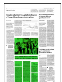
Superficie 34 %

Nel periodo si sono svolte 32 manifestazioni fieristiche (23 in Italia e 9 all'estero 15 direttamente organizzate e 17 ospitate), 61 eventi congressuali (di cui 26 eventi congressuali con annessa area espositiva) per un totale di 790.620 metri quadrati totali occupati