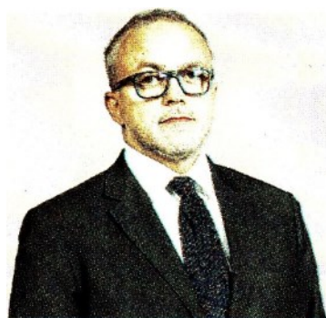
ERNESTO MARIA RUFFINI direttore delle Entrate (intervista in occasione di Telefisco 2022)