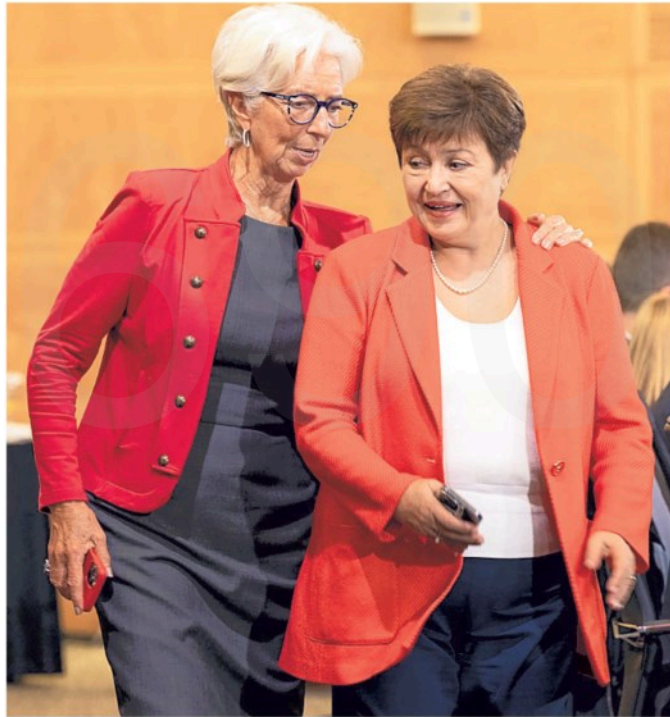
Christine Lagarde (Bce) e Kristalina Georgieva, direttrice del Fmi