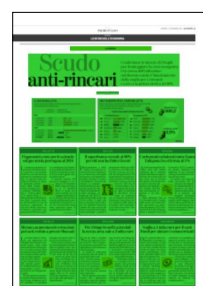
Superficie 82 %

ARTICOLO NON CEDIBILE AD ALTRI AD USO ESCLUSIVO DEL CLIENTE CHE LO RICEVE - L.1878 - T.1615