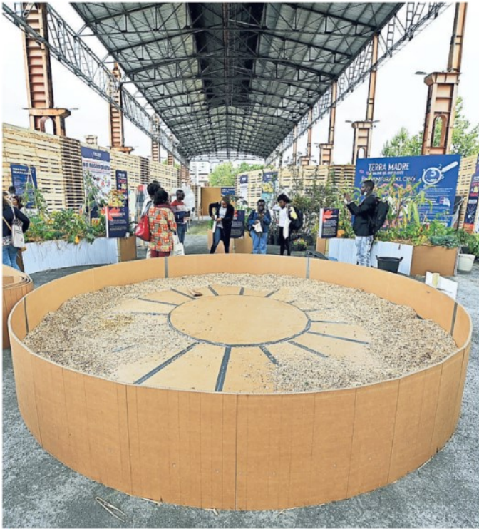
▲ L'esordio Il Salone del Gusto a Parco Dora