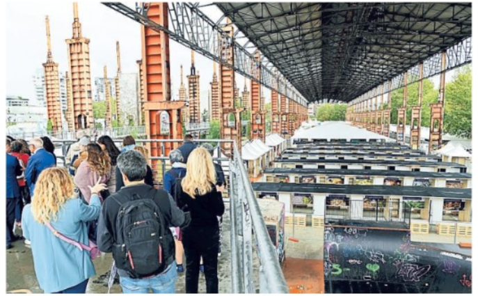
▲ Debutto Per la prima volta il Salone del Gusto si svolge a Parco Dora