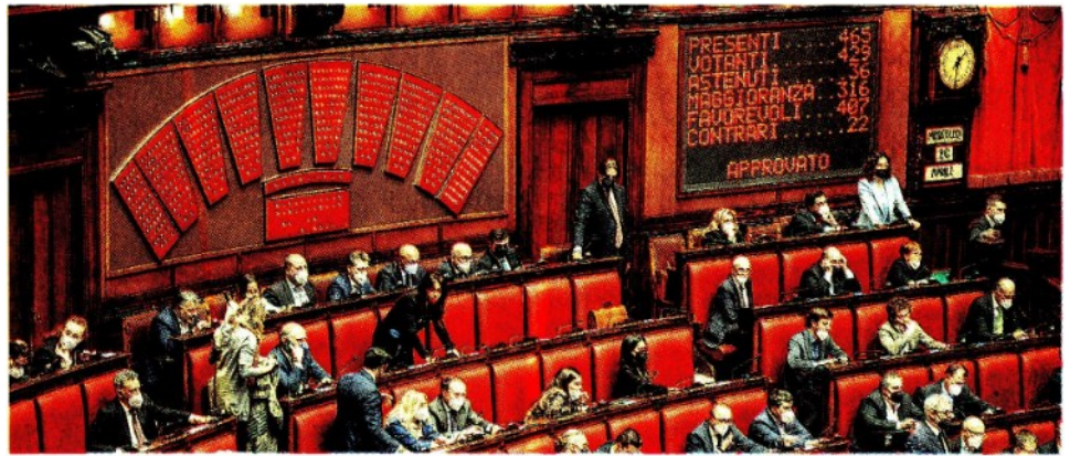
Via libera al Def. Camera e Senato hanno approvato ieri le relazioni di maggioranza sul Def. In foto il voto a Montecitorio

Le nuove iniziative espansive del governo dovranno anche andare nella direzione di assicurare la necessaria liquidità alle imprese mediante la concessione di garanzie anche alla luce della nuovo quadro temporaneo degli aiuti di Stato e ai settori maggiormente colpiti dalle attuali emergenze