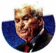
CARLO SANGALLI Presidente di Confcommercio