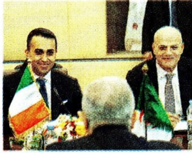
Algeria. Luigi Di Maio e Claudio Descalzi