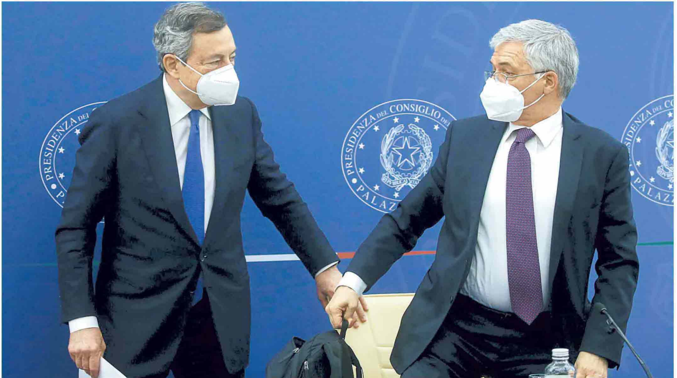
Il presidente del Consiglio Mario Draghi con il ministro dell'Economia Daniele Franco

Stamattina il premier all'assemblea di Confindustria Focus sul Recovery