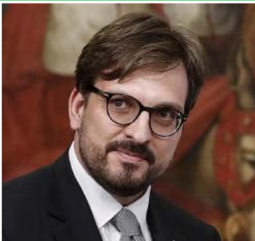
L'assessore regionale Guido Guidesi